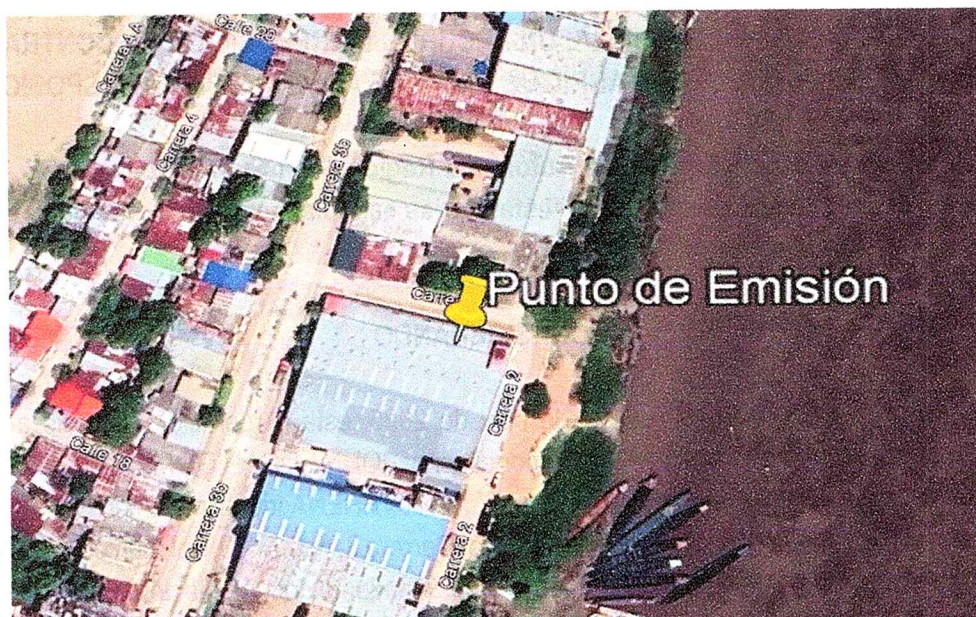
Imagen 1. Punto de emisión.